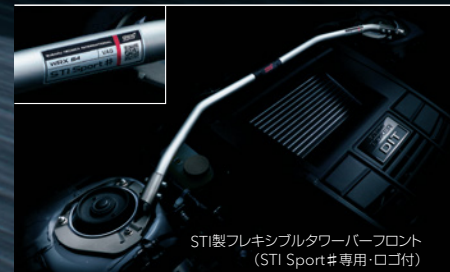
STI製フレキシブルタワーバーフロント （STI Sport#専用・ロゴ付）

フロアに採用している遮音材、さらにスペアタイヤバン内に配置している防振材を強化することで静粛性を向上。振動や騒音を低減したストレスを感じさせない快適空間でドライビングを愉しむことができます。