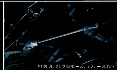
STI製フレキシブルドロースティフナーフロント