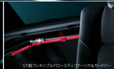
STI製フレキシブルドロースティフナーリヤ&ガードバー