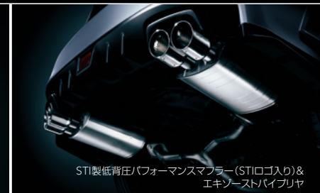
STI製低背圧パフォーマンスマフラー（STIロゴ入り）& エキゾーストパイプリヤ