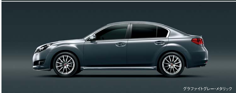
グラファイトグレー・メタリック