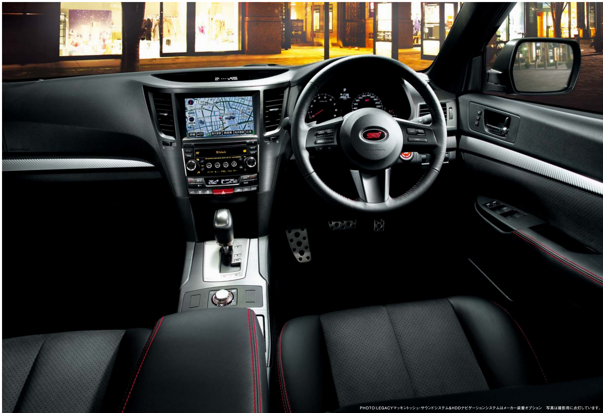
PHOTO:LEGACYマッキントッシュ・サウンドシステム&HDDナビゲーションシステムはメーカー装着オプション 写真は撮影用に点灯しています。