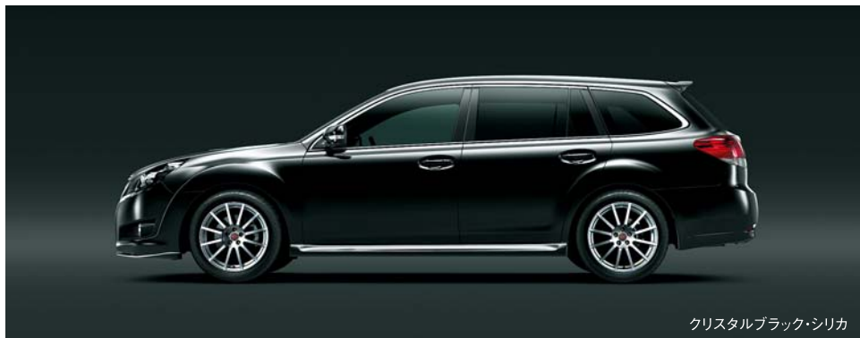
クリスタルブラック・シリカ