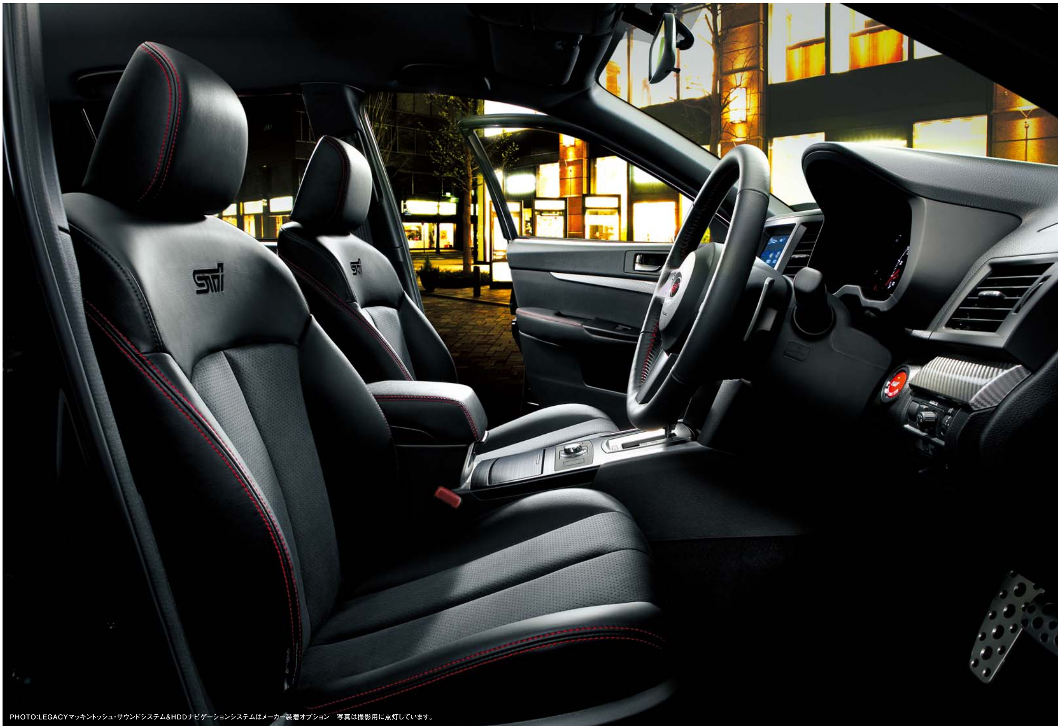
PHOTO:LEGACYマッキントッシュ・サウンドシステム&HDDナビゲーションシステムはメーカー装着オプション 写真は撮影用に点灯しています。