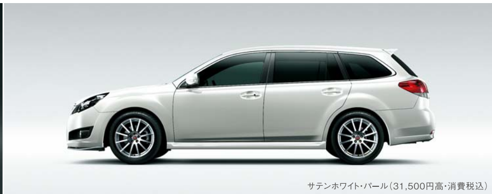
サテンホワイト・パール(31,500円高・消費税込)