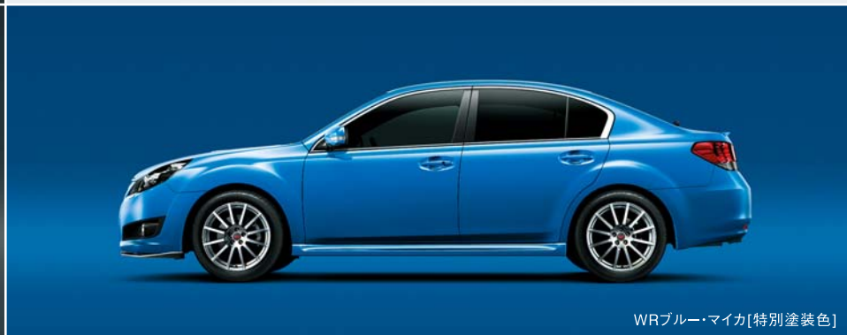
WRブルー・マイカ[特別塗装色]